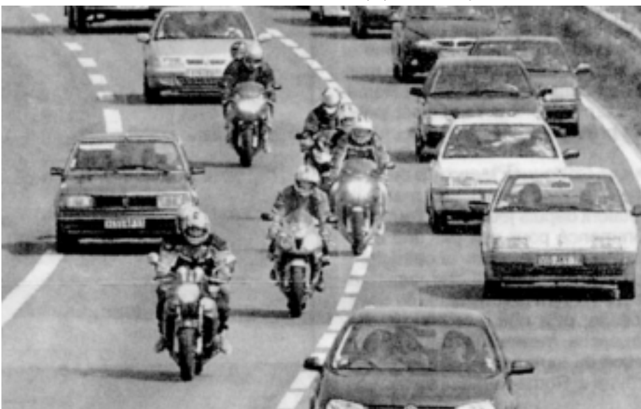
Plus de 900 000 motards en France...

Je ne peux pas accepter que dans un but de sécurité les usagers soient incités à ne pas respecter la loi et peut encore moins accepter que ces mesures exposent les usagers des deux roues à des risques particuliers. Michel Bougain est avocat à Perpignan. Mais c'est en tant que motard qu'il vient de déposer plainte contre la préfecture de la région à la suite d'une campagne... de sécurité ! A l'occasion du week-end de la Pentecôte, la préfecture