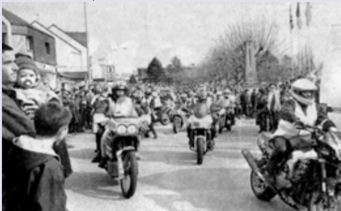
Près de 1 800 motos se retrouvaient ce dimanche, sur la place de la mairie à Questembert, pour récolter des dons pour lutter contre la sclérose en plaques