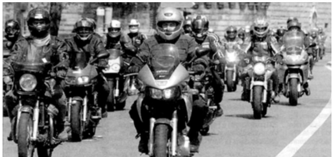
À Nantes, environ 200 motards ont fait le tour du périphérique pour protester contre ce qu'ils appellent le « racket routier ».

Note : nous signalons à nos adhérents qui se poseraient la question « pourquoi y a-t-il rien eu à Rennes ? » que nous avons pris des engagements sur des actions de sécurité routière lorsque la date a été fixée par la FFMC nationale. La prochaine fois on vous en organise une, promis !